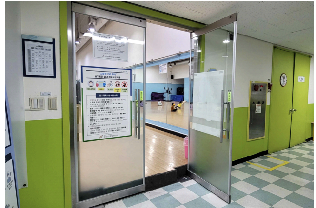
[그림 1] 바닥의 덧붙임 공사로 발생한 단차

조사대상의 대부분 시설은 접근로와 건축물 주출입까지의 기본적인 접근성은 갖추고 있으나, 실의 용도 변경 등으로 유추되는 수선으로 인해 발생한 단차 등 출입문에 턱이 생겼으며, 이로 인해 실 접근의 어려움이 발생함을 확인할 수 있었다. 수직이동 시설로는 대부분 승강기가 설치되어 있었고 관련 항목은 90~80%이상의 적합율을 보이고 있다. 승강기 설치가 어려운 경우 내부 경사로를 설치하였으나, 이는 승강기에 비해 낮은 적합율을 보이고 있다. 특히 '공평한 사용' 부분에서 주의 깊게 살펴야 하는 부분은 용도상 다른 시설과 구분될 수 있는 체육시설의 특징이라 할 수 있는 수영장의 পুল에 접근할 수 있는 접근로의 설치가 미비하여 장애인 등이 이용하기에 어려움이 발생하고 체육활동 전과 후 샤워실과 탈의실의 이용이 어려움을 확인할 수 있다. 이는 생활체육시설에서 가장 중요한 시설이 모든 사용자를 수용하고 있지 못함을 보여준다. 시설 개선은 특정 사용자를 위한 시설과 공간으로 구분하기보다 모두가 사용가능하도록 계획하고 사용자의 다양한 상황을 고려하여 물리적·심리적으로 사용자를 분리시키지 않는 계획 및 운영이 필요하다. 장애인 '전용'이라는 개념보다는 모두가 이용하는 편의시설의 개념으로서의 접근이 필수적이다. [그림 1]은 바닥의 덧붙임 공사로 인해 단차가 발생하고 여담이문이 밖으로만 열리게 된 것을 보여준다.